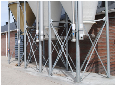
Abords extérieurs propres, aucun reste d'aliment en-dessous et autour des silos