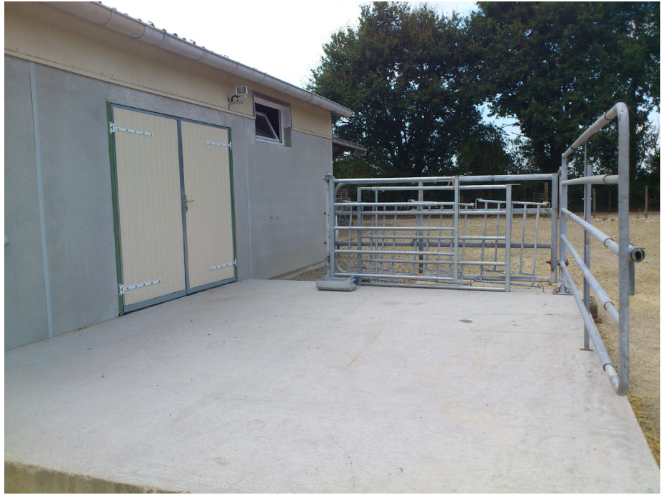
Exemple de quai d'embarquement équipé d'un système d'éclairage et d'un pédiluve

A la fin du chargement ou du déchargement, le chauffeur devra nettoyer et désinfecter ses bottes.